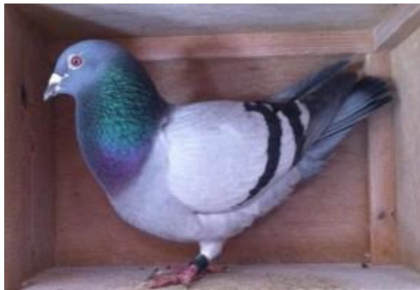
De winnares de 792.