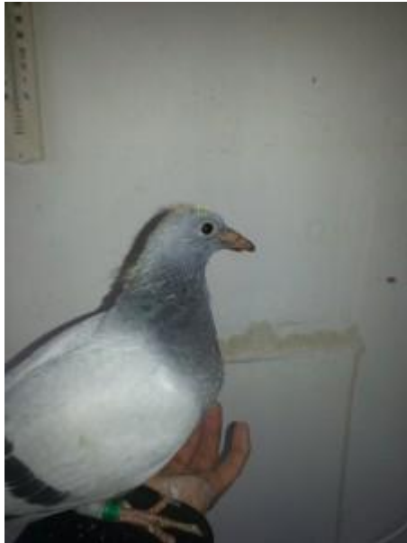
Toevallig een foto van de 902 als jonge duif.